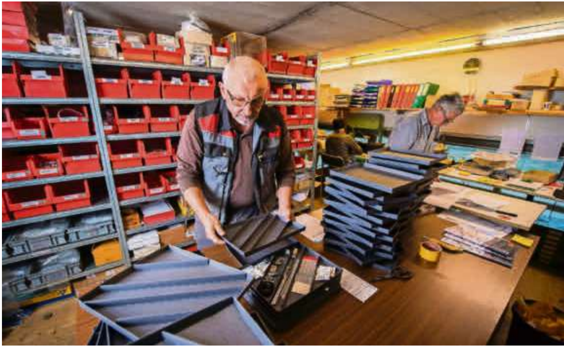
Die Stokys-Mitarbeiter setzen am Firmenstandort in Bauma in Handarbeit die neu gestalteten Werkzeugkästen zusammen.